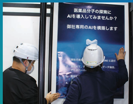
ポスター掲示等サポート