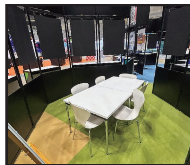
パビリオン内商談ルーム